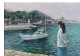
4位：大田玲子 「はじまる」 132票