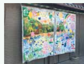
④2017年ライブペイント作品