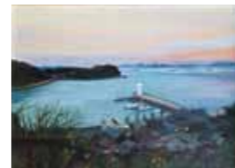
9位：藤井康代 「おいらん公園より」 92票