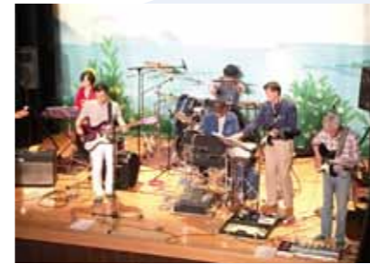
4/29 乙女座ライブPart1 ダイヤモンドヘッズ(乙女座)