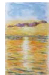
8位：城 武昌 「朝のひかり」 95票