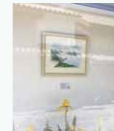
←①寿山美代子作品 2017年潮祭公募展 大賞