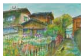
6位：船本由利子 「御手洗の午後」 110票