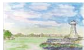
3位：城 武昌 「みたらい」 146票